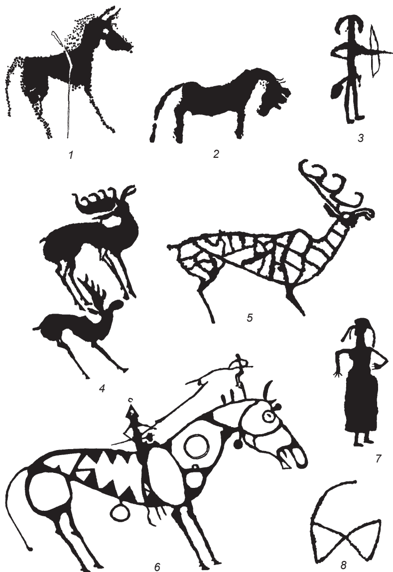
Рис. 7. Образы и сюжеты петроглифов Билуут-Толгоя.

Одни лошади запечатлены в достаточно реалистичной манере, грациозными. У них длинные и ноги, и шея, маленькая голова. Другие – с коротким туловищем и короткими толстыми ногами, короткой шеей и большой головой, наклоненной вниз. Фигуры лошадей первого типа в Билуут-Толгое присутствуют рядом с изображениями быков и колесниц (ранняя и развитая бронза). Фигуры лошадей второго типа (рис. 7, 1, 2) датируются, вероятно, поздней бронзой (андроновская или карасукская эпоха) и по стилистическим особенностям соответствуют образу коня, воплощенному в петроглифах Казахстана [Самашев, Курманкулов, Жетыбаев, 2000, рис. 2–4].