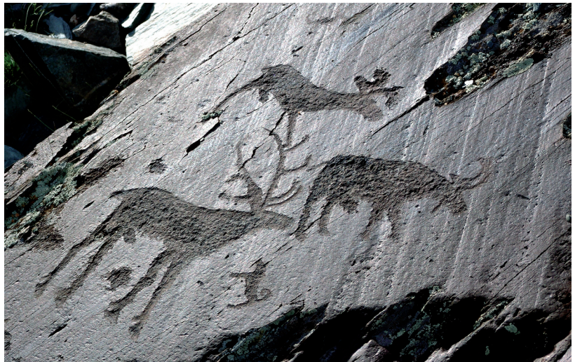
Рис. 5. Изображения главных промысловых животных: лося, быка и оленя.