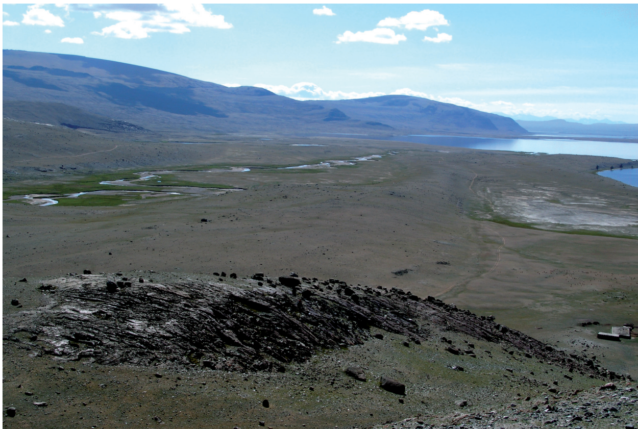
Рис. 2. Вид на пункт с петроглифами Билуут-Толгой-2 с запада.