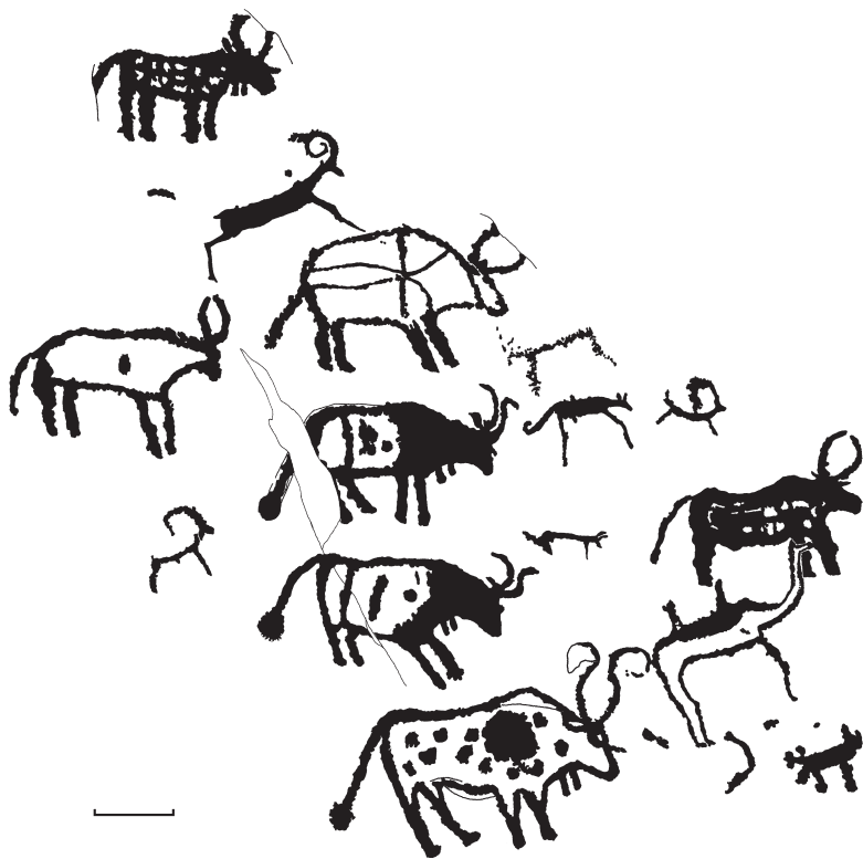
Рис. 3. Композиция с быками и другими животными. Эпоха ранней бронзы.

значены как самостоятельные пункты – Билуут-Толгой-1–3. Памятник открыт монгольским археологом Х. Едилханом, а первые сведения о нем были указаны в лаконичном сообщении об исследованиях Монгольско-американско-казахской экспедиции в 2004 г. [Kortum et al., 2005].