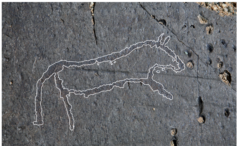
Рис. 6. Изображение лошади эпохи ранней бронзы.