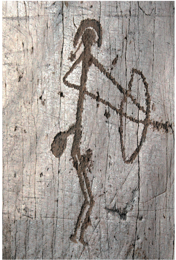
Рис. 8. Фигура хвостатого лучника в серповидном головном уборе.

На скалах Билуут-Толгой нанесено несколько знаков-тамг в виде схематичной фигурки козла. Одна из них, предельно стилизованная, сведенная к символу (см. рис. 7, 8), находит параллели в петроглифах Цагаан-Салаа и Бага-Ойгура [Кубарев, Цэвээндорж, Якобсон, 2005, прил. 2, рис. 116, 15, 16]. Подобный знак также многократно дублируется на стелах в