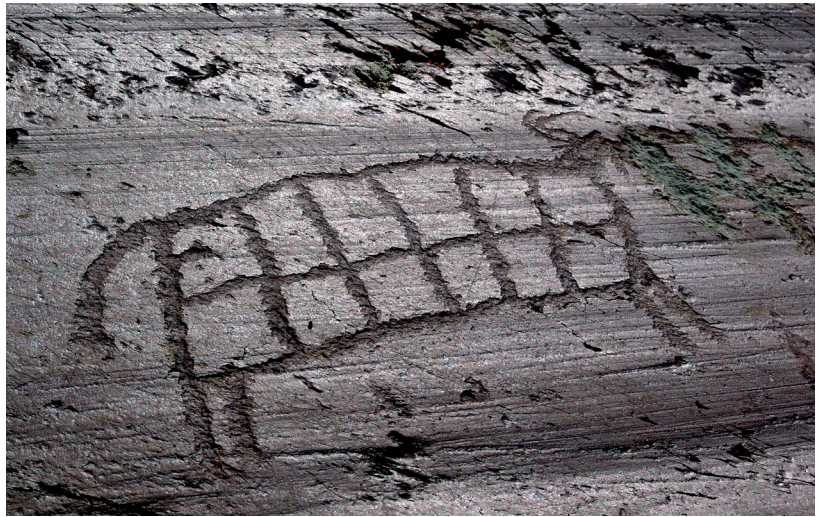
Рис. 4. Изображение быка с туловищем, поделенным на 12 квадратов.

К бронзовому веку следует отнести изображения лосей и оленей (маралов?) с древовидными рогами. Интересно, что эти крупные промысловые животные иногда показаны в одной сцене с быками, вероятно дикими (рис. 5). Этим же периодом датируются как одиночные изображения лошадей (рис. 6), так и групповые – в виде небольшого табуна (3–8 особей), сопровождаемого волками или собаками. Лошади, как и другие животные, показаны в движении и ориентированы вправо. Отсутствие человека в таких сценах дает основание предположить, что на рисунках отображены дикие животные. Но и среди них представляется возможным различить изображения двух типов.