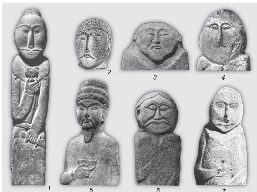
Рис. 1. Изображения черт лица на реалистичных древнетюркских изваяниях Семиречья (1–6) и Тувы (7).

1 – по: [Федоров-Давыдов, 1976]; 2 – по: [Чариков, 1980]; 3–5 – по: [Шер, 1966]; 6 – по: [Маргулан, 2003]; 7 – по: [Грач, 1961].