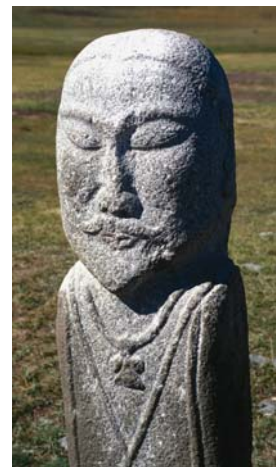
Рис. 7. Изваяние “Даян-батыр”. Монголия.