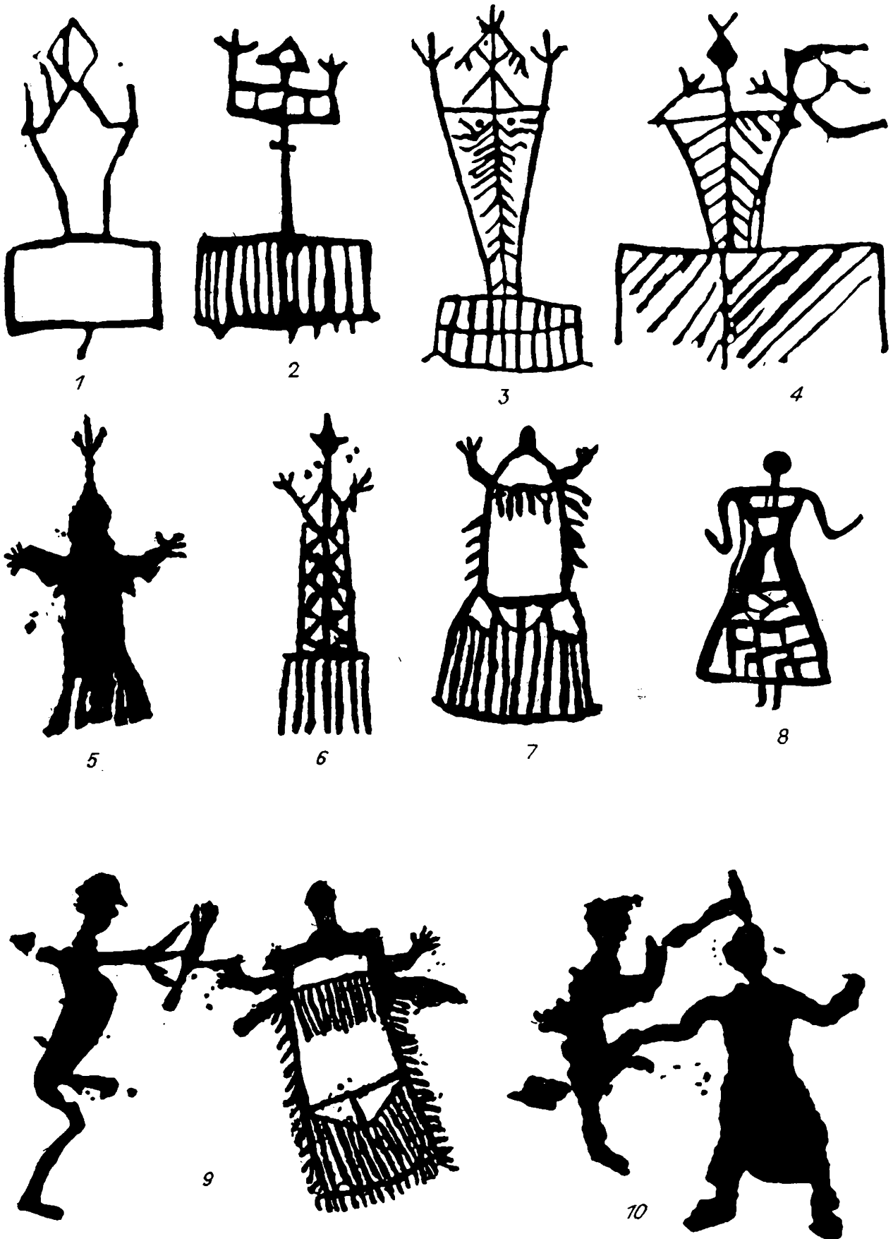
Рис. 1. Антропоморфные фигуры.

1—4 — Монголия, р. Чуулут (по Э. А. Новгородовой); 5—7, 9 — Алтай, Калбак-Таш (по В. Д. Кубареву); 8 — Тува, Бижикиг-Хая близ пос. Кызыл-Мажалык; 10 — Тува, Мугур-Саргол.