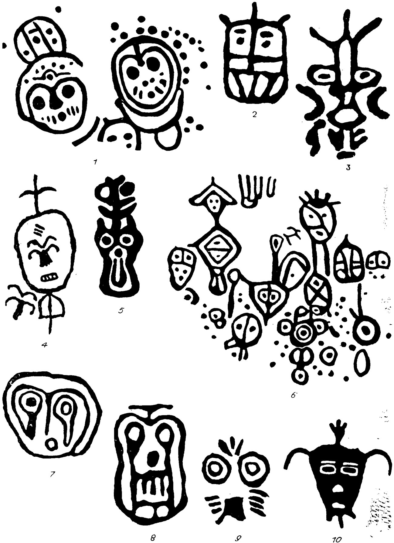
Рис. 4. Личины-маски.

1—9 — Внутренняя Монголия, горы Иньшань (по Гай Шаньлину); 10 — Чулуут (по Э. А. Новгородовой).