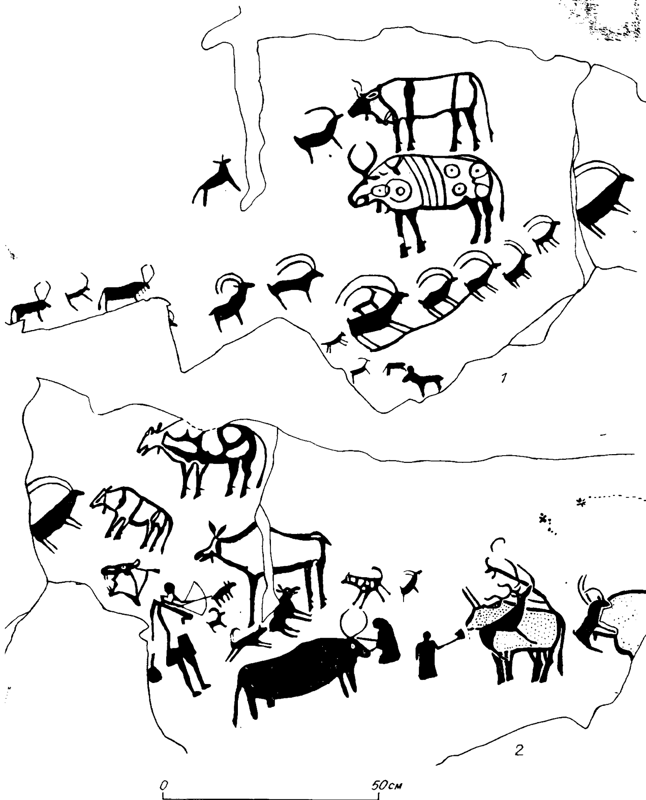
Рис. 3. Наскальная композиция. Бижиктиг-Хая близ пос. Кызыл-Мажалык. 1 — левая; 2 — правая части плоскости.