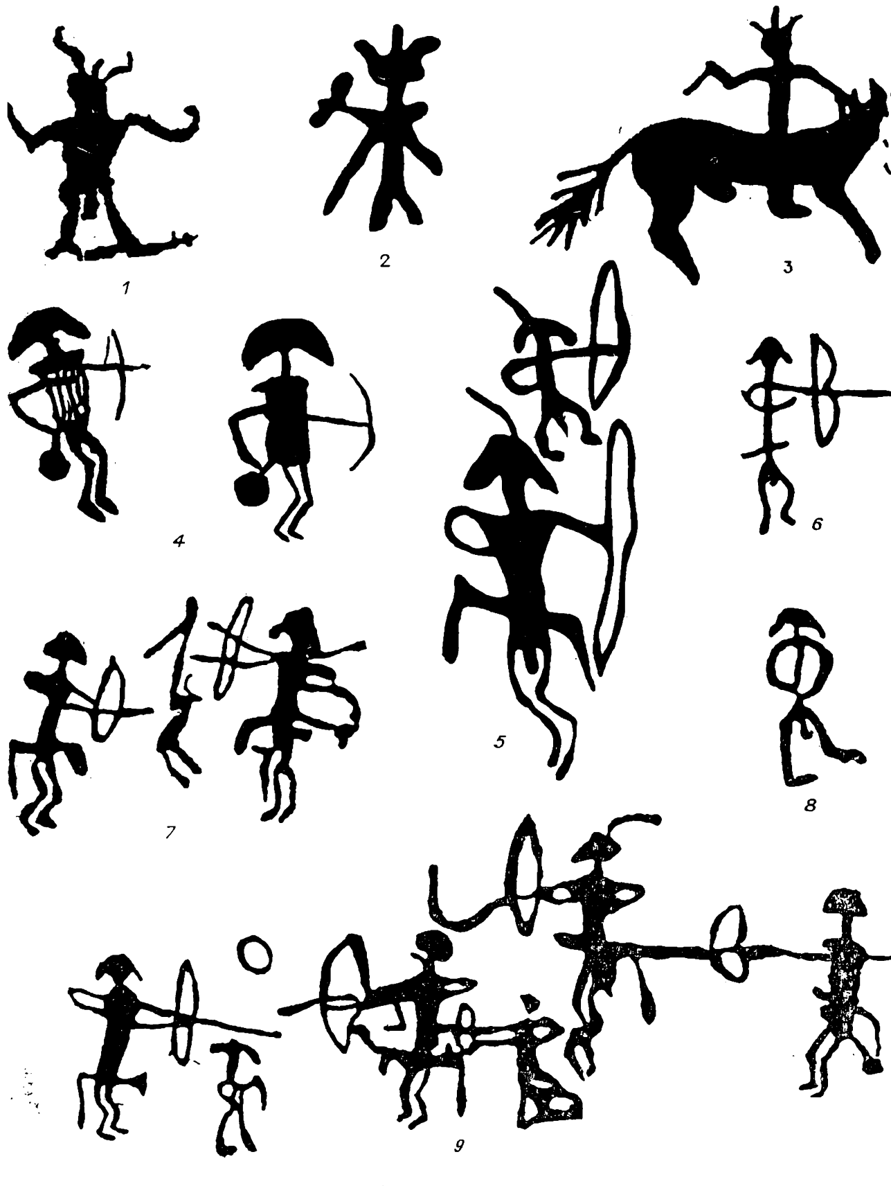
Рис. 6. Антропоморфные фигуры в рогатых и грибообразных головных уборах.

1 — Мугур-Саргол; 2, 5 — Монголия, Хавцгайт (по А. П. Окладникову); 3, 6 — Монголия, Бичигтынам, Баянхонгорский аймак (по Н. Сэр-Оджаву); 4 — Тува, Оргаа-Саргол; 7—9 — горы Иньшань (по Гай Шаньлину).