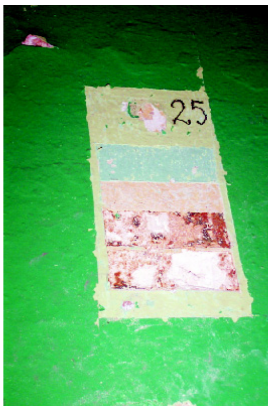
7. Художественный зондаж в Романском зале