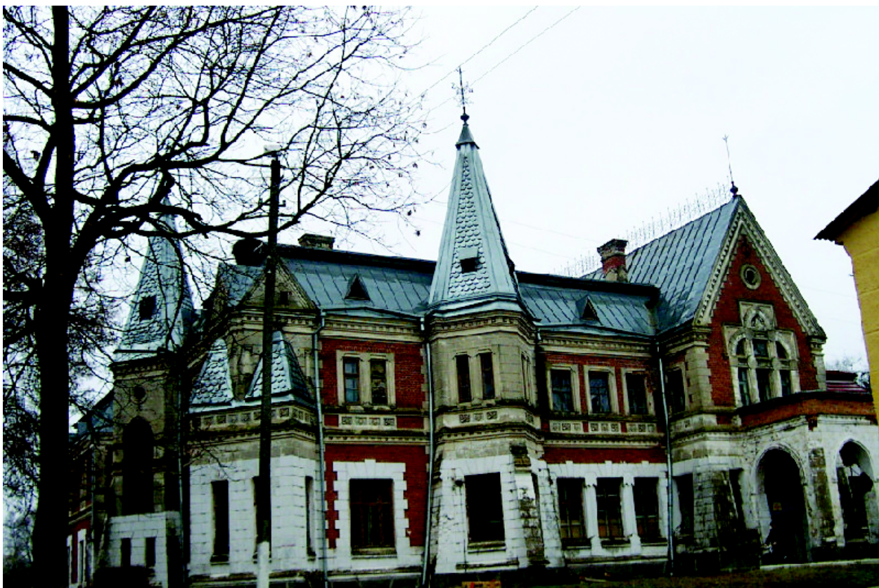
1. Главный фасад усадебного дома до реставрации