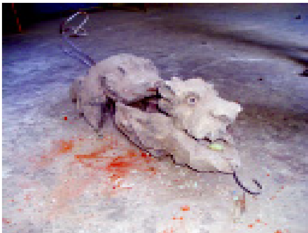
3. Аутентичное декоративное оформление водостока в виде горгульи