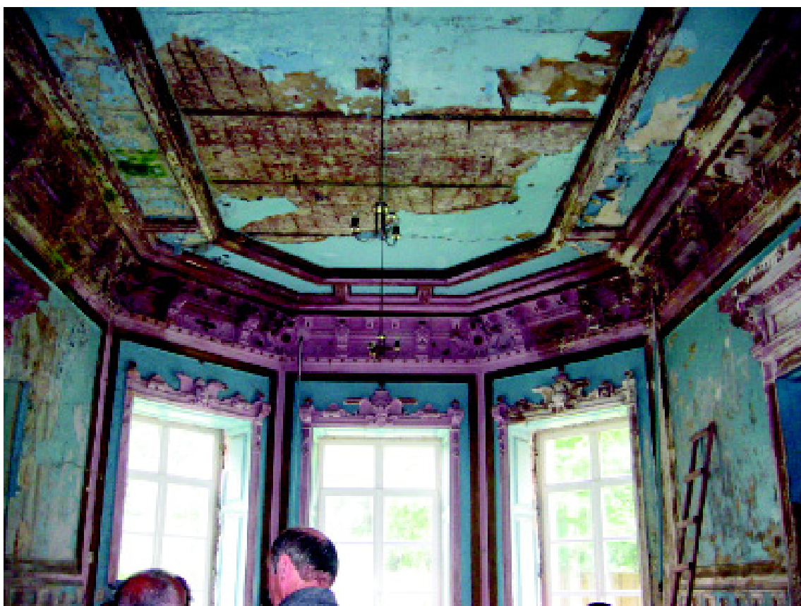
5. Зал в стиле позднего Возрождения до реставрации