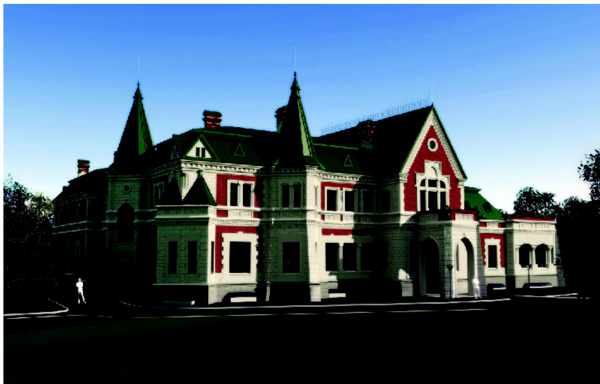
2. Главный фасад усадебного дома. Проект реставрации