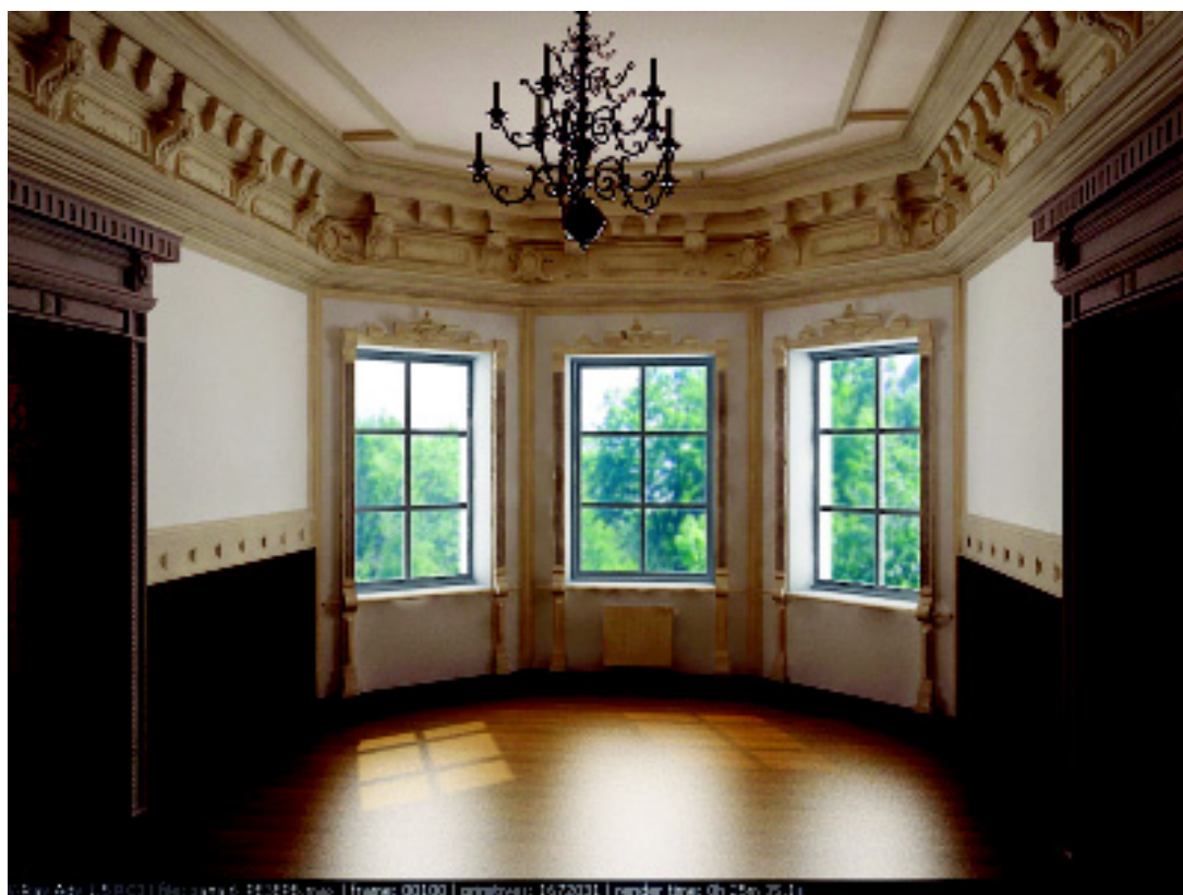
6. Зал в стиле позднего Возрождения после реставрации. Проектное решение.