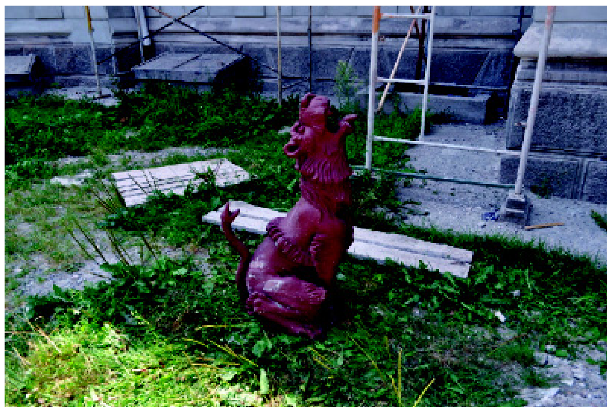
4. Воссозданное декоративное оформление водостока в виде горгульи