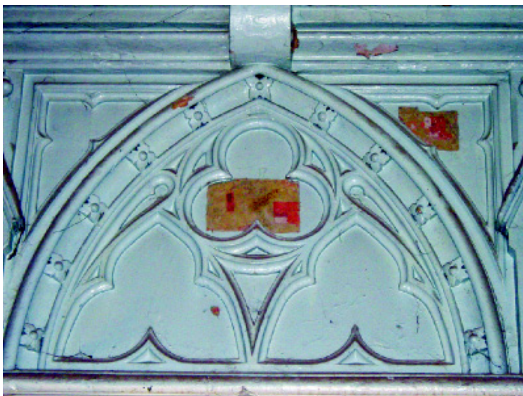
8. Художественный зондаж в Неоготическом зале