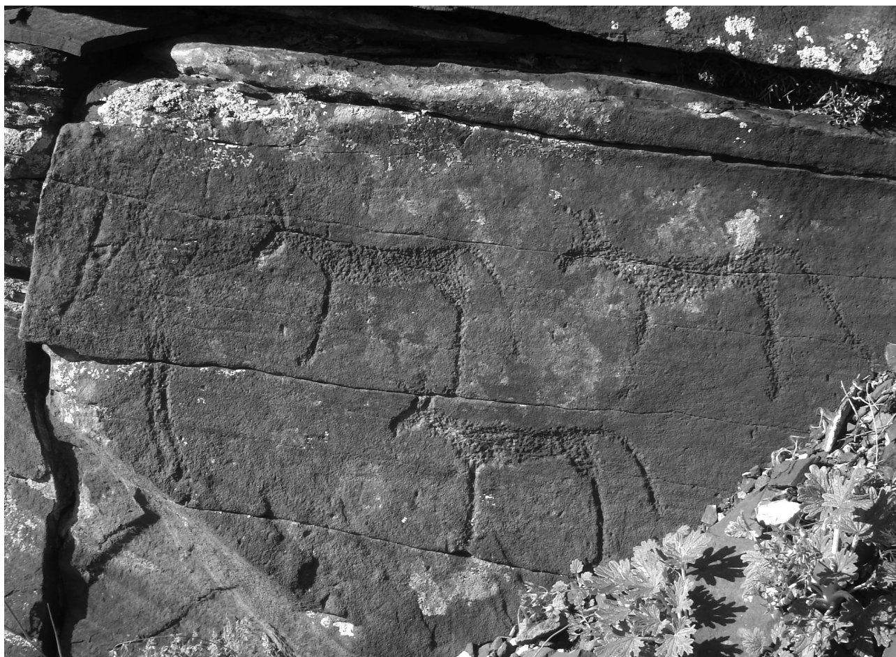
Рис. 2. Тепсей II. Новый фрагмент «Тепсейского фриза».

– Безусловно, отдельного внимания заслуживают петроглифы курганных камней. Этот новый источник дает представление об изо-