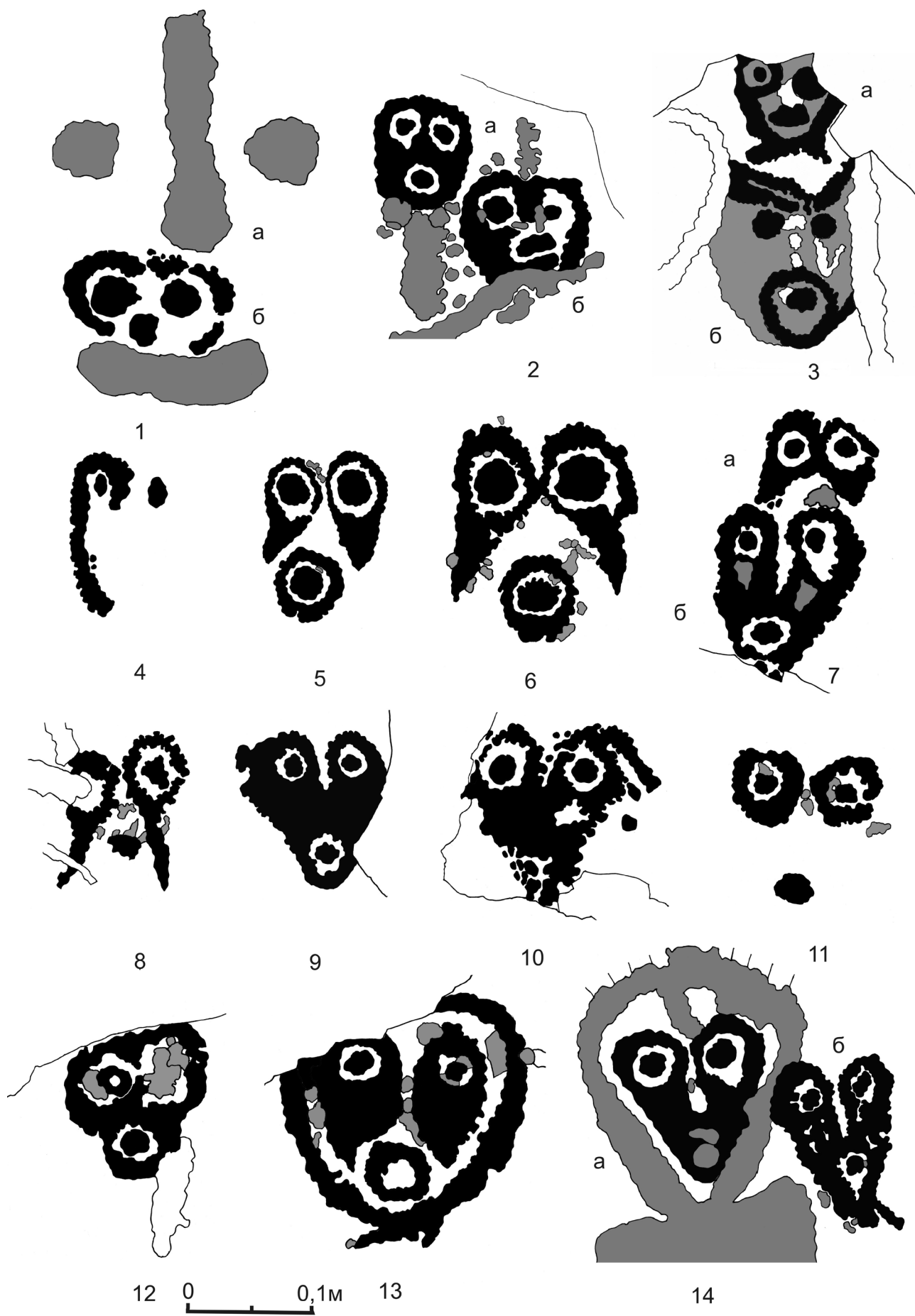
Рис. 2. Антропоморфные личины (1–14) на погребальной плите могильника Узун-Харых.